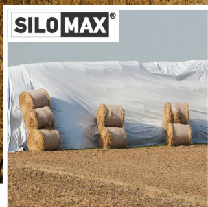
ΑΣΠΡΟΜΑΥΡΟ ΦΙΛΜ ΕΝΣΙΡΩΣΗΣ