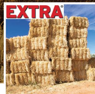
EXTRA ΣΠΑΓΚΟΣ ΧΟΡΤΟΔΕΣΙΑΣ

Κεντρικό: Λόφος Κυρίλλου (Έξοδος 4 Αττικής Οδού) Ασπρόπυργος Αττικής, 19300 T: 210-5584312-14, F: 210-5584315