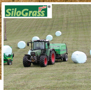
ΦΙΛΜ ΕΝΣΙΡΩΣΗΣ SILOGRASS 5 PLUS